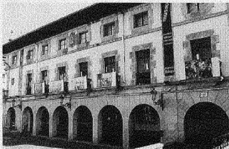
Gernika-Lumoko Bakearen Museoa. ANE MARURI ARANSOLO

Martxoaren 31ra bitartean, ateak irekitzeaz gain, adin guztietako herritarrei zuzendutako jarduerak edukiko dituzte auke-