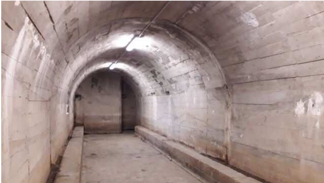
Interior del búnker, de 22 metros de largo y cinco de ancho