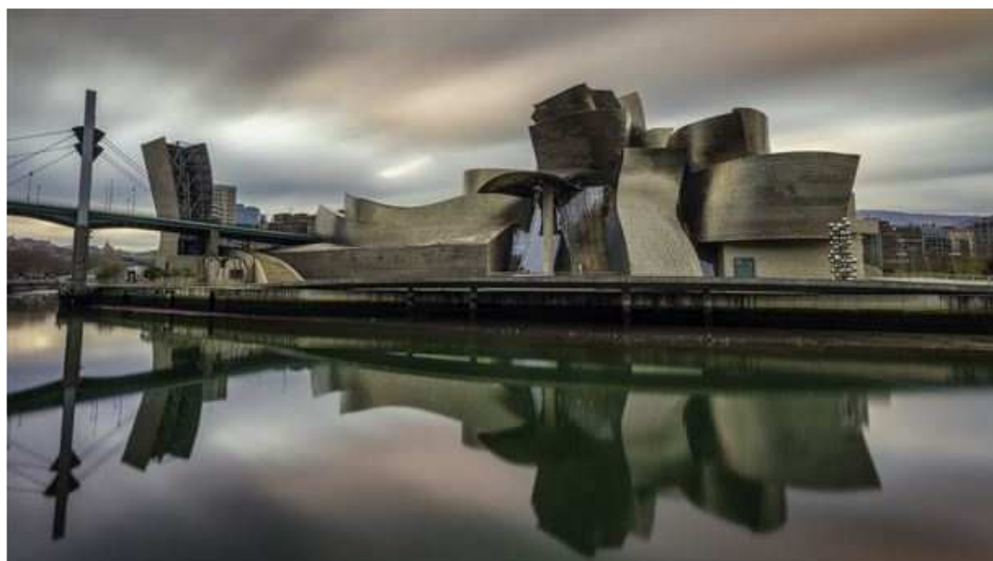
Museo Guggenheim de Bilbao.

En total, se desarrollarán unas 65 actividades en museos de 24 municipios de Bizkaia. Algunas se celebrarán el sábado, aunque la mayoría se podrán disfrutar a lo largo de todo el fin de semana.