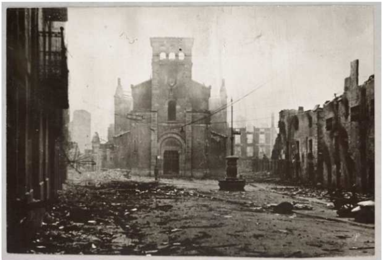
Guernica en ruines après le bombardement du 26 avril 1937.

Ce mardi 5 février, on prend la route de Guernica, ou Gernika comme c'est écrit sur les panneaux en basque au bord de l'autoroute qui serpente depuis Bilbao parmi les collines. Il fait beau, c'est déjà le printemps au Pays basque, avec ces chalets qui évoquent le Tyrol ou les Alpes. On aurait plutôt l'impression de partir en week-end que de se rendre dans une ville martyre – à laquelle le musée de l'Armée aux Invalides rend hommage jusqu'au 28 juillet avec l'exposition « Picasso et la guerre » – symbole universel d'un XXe siècle sanglant, bombardée par l'aviation de Mussolini puis d'Hitler le 26 avril 1937, un lundi, parce que c'était jour de marché et que les bombes feraient encore plus de morts. Frapper fort pour soutenir le coup d'Etat nationaliste de Franco contre le gouvernement de la Seconde République espagnole, en pleine guerre civile, deux ans avant l'embrasement mondial.