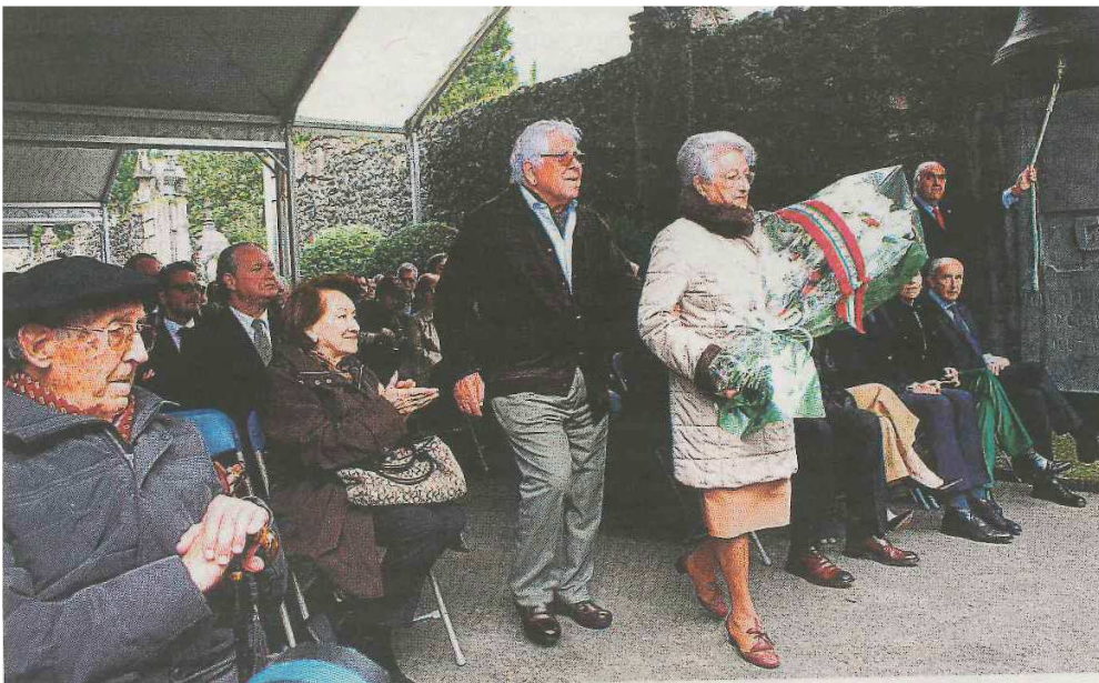
Urtero legez, bonbardaketan hildakoak gogoratzeko elizkizuna eta lore eskaintza burutu dute.