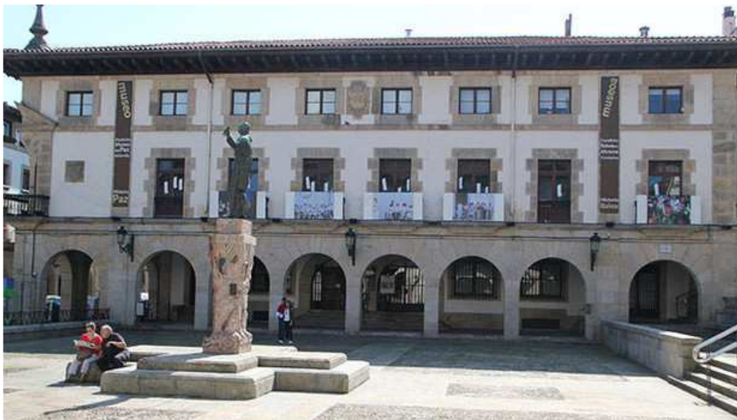
El Museo de la Paz.

Jueves, 9 de Mayo de 2019 - Actualizado a las 07:26h