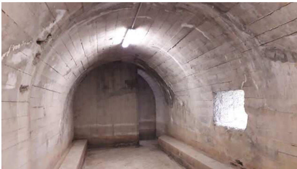
Interior del búnker de Gernika ELDIARIONORTE.ES