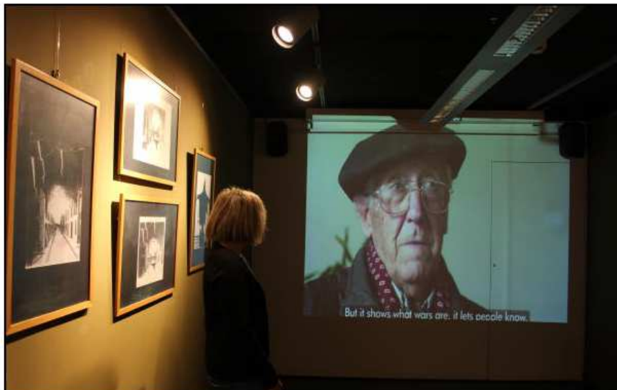
Bakearren Museoak 50.000 bisitari baino gehiago izan ditu