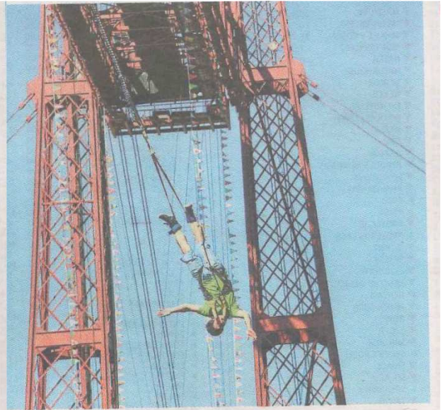
Un hombre salta del Puente Bizkaia atado con una goma.

El regreso al Magdaleniense, hace unos 15.000 años, es la sugerencia de la cueva de Santimamiñe. Iñaki