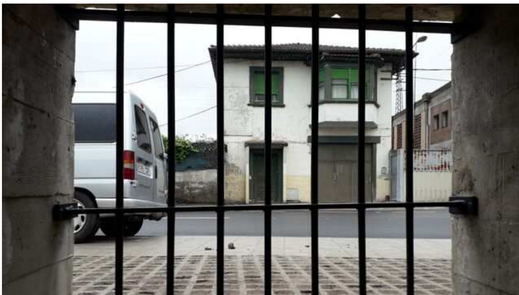
Ventana del búnker, con vistas a la calle Ibarra