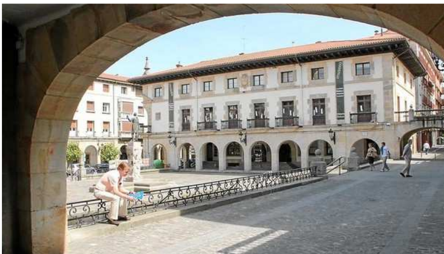
El Museo de la Paz de Gernika (I. fradua)

EFE - Miércoles, 8 de Mayo de 2019 - Actualizado a las 17:43h