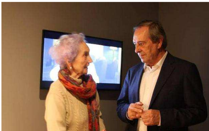
El alcalde de Gernika con una de las supervivientes en el museo.

Gogora ha inaugurado en el centro museístico una nueva muestra audiovisual con testimonios de quienes vivieron el ataque aéreo