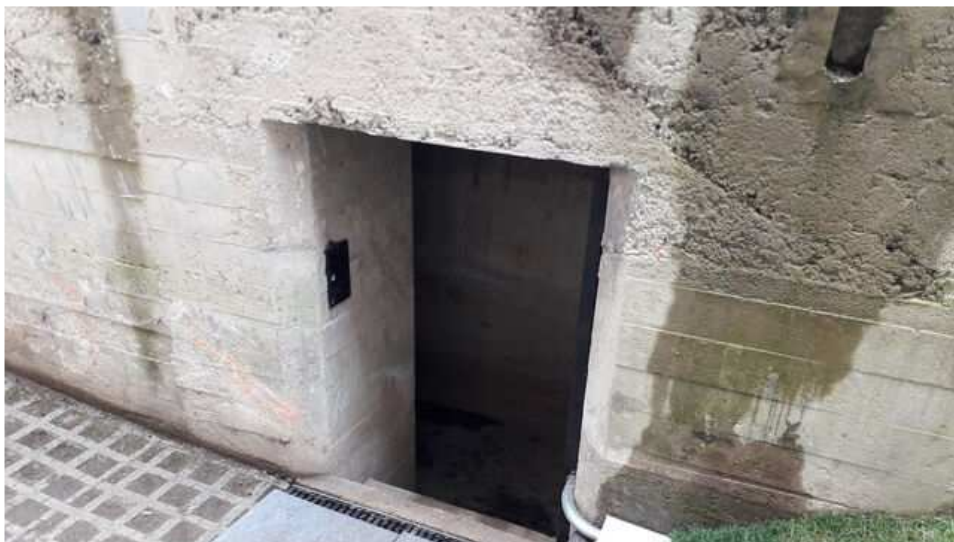
Entrada del búnker

“Gernika no olvida, pero su dolor no ha sido en vano, siempre y cuando sea recordado”, así lo sienten las 12 víctimas que ponen nombre y voz al trágico suceso que vivieron, en un intento de saltar de los libros de historia a la memoria colectiva.