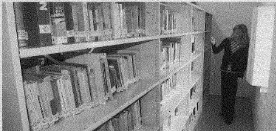
Instalaciones del Centro de Documentación del Museo de la Paz.

El Centro de Documentación del Bombardeo de Gernika acudió el pasado año a archivos de París, Madrid y Alcalá de Henares