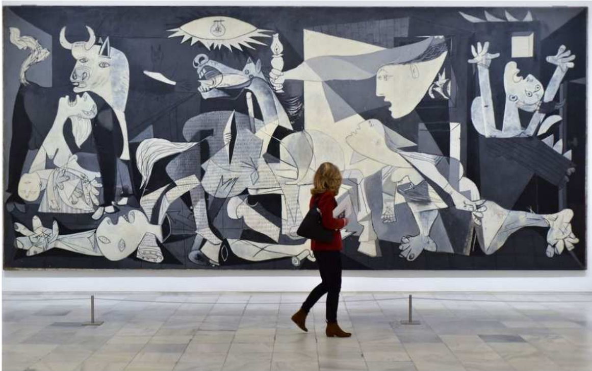
« Guernica » ne quitte jamais le musée Reina Sofia de Madrid, mais des œuvres préparatoires sont présentées à Paris pour l'exposition « Picasso et la guerre » au musée de l'Armée. David Alonso Rincon

Alors que le musée de l'Armée aux Invalides à Paris présente une exposition sur «Picasso et la guerre», reportage dans la ville martyre qui inspira son tableau le plus célèbre.