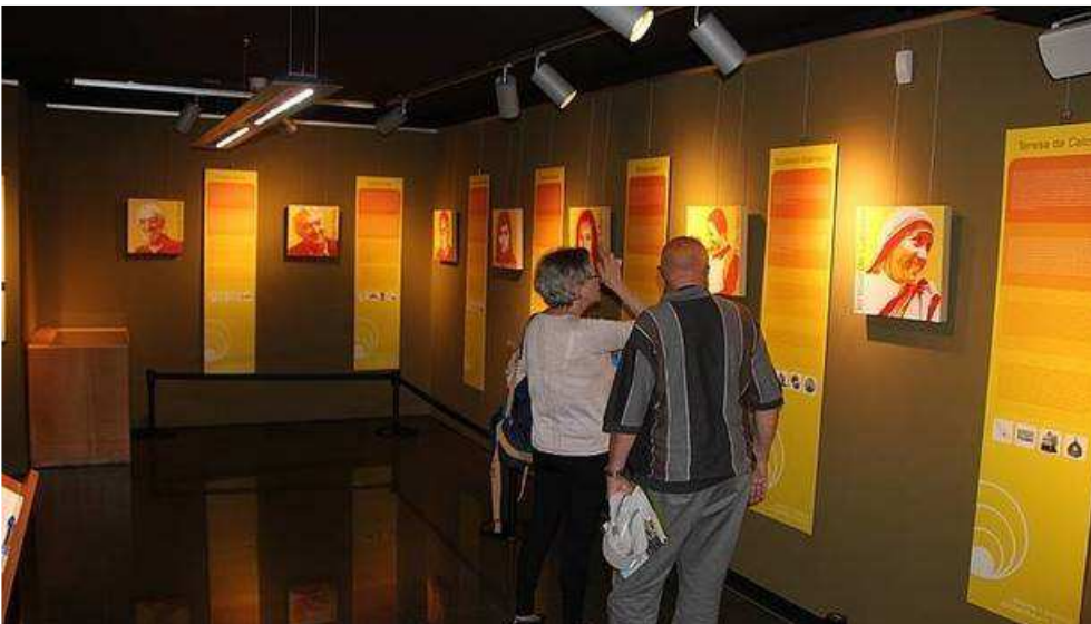
Una de las muestras que han pasado por el Museo de la Paz de Gernika-Lumo el pasado año.

IMANOL FRADUA - Sábado, 12 de Enero de 2019 - Actualizado a las 06:00h