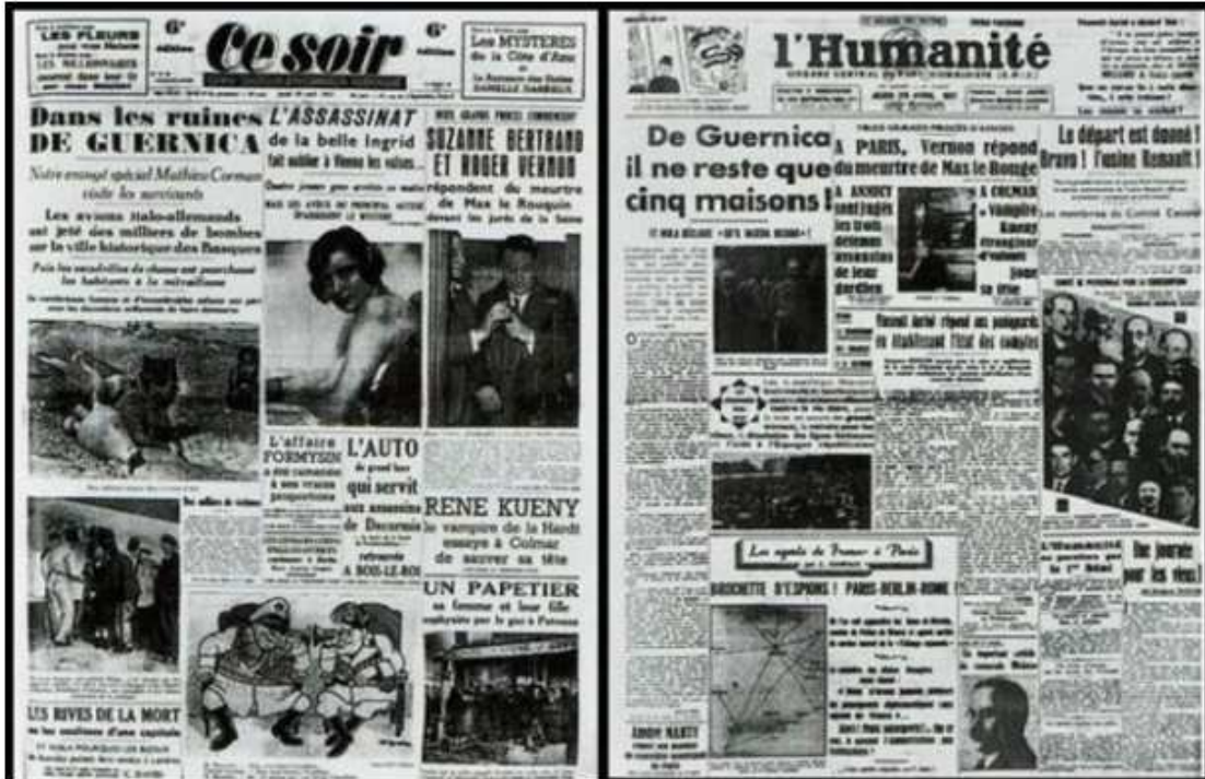
Les unes du 27 avril 1937.