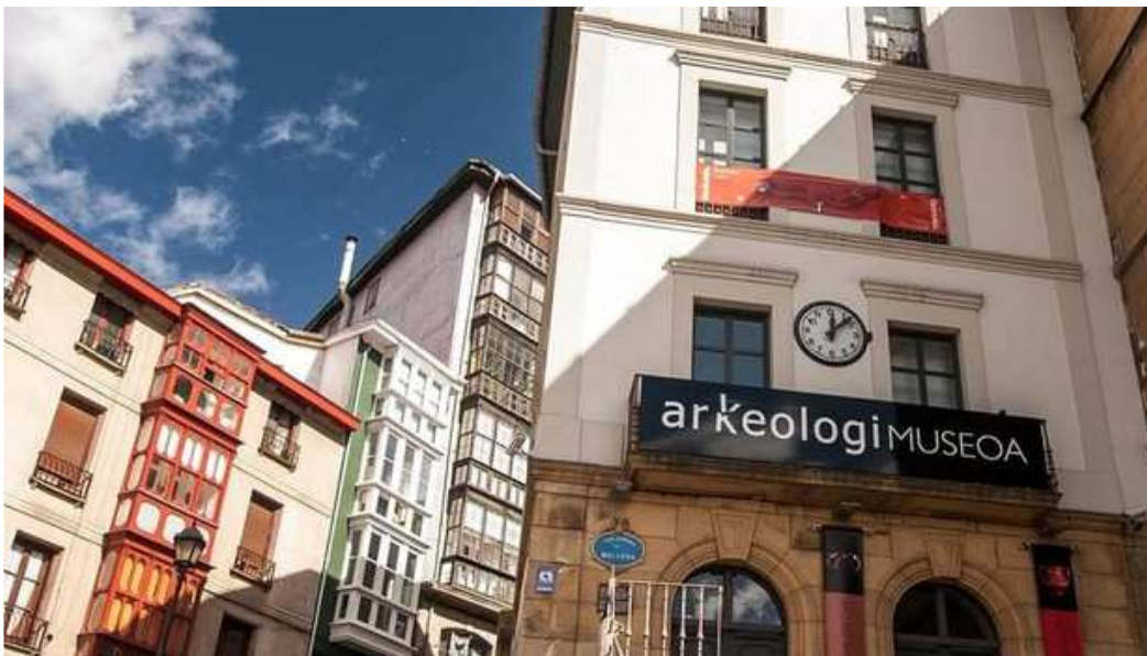
Arkeologi Museoa.

EFE - Lunes, 13 de Mayo de 2019 - Actualizado a las 13:46h