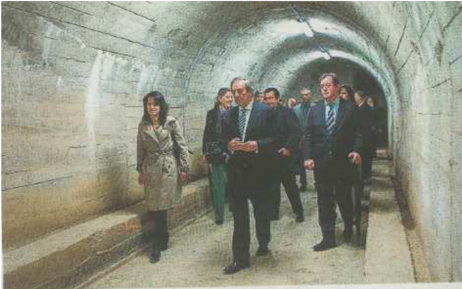
Talleres de Gernikako babeslekua inauguratu zuten bariku goizean. TOHIBIO