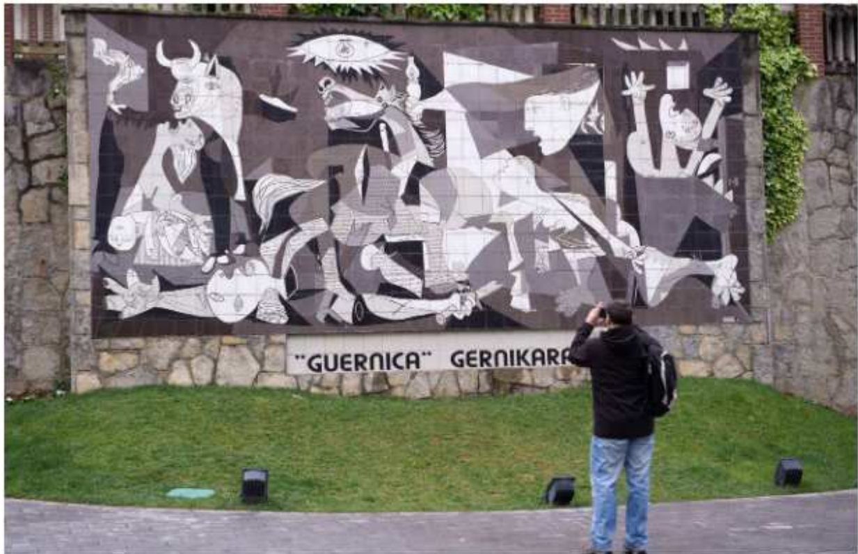
Une fresque reproduisant le tableau avec l'inscription « Gernikara ».

La reconstitution d'une salle à manger de l'époque, qui vous plonge dans ce 26 avril 1937, avec une table, quelques chaises, une photo de famille, des rideaux, le charbon qui manque, et soudain le bruit des sirènes fait son effet. Tout le monde se demandait où les bombes allaient tomber. Franco voulait briser la résistance basque. La ville voisine de Durango avait été bombardée le 31 mars, mais aucun grand artiste ne l'a peinte, et tout le monde a oublié, à part les historiens spécialisés et les locaux. « À Durango, on est agacé que l'on parle toujours de Guernica », confie la guide. Puissance de l'art.