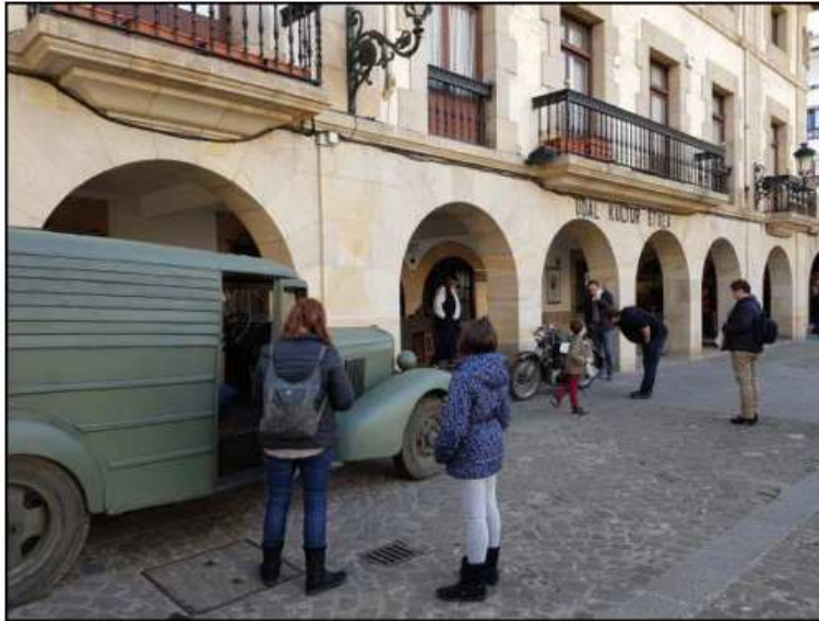
1937ko gernikaren errekreazioa egin zuten

Musika edota zinema ardatz izan dituzten bisita gidatuak ere eskaintza izan zen iaz, eta Afaloste laborategu gastronomiko sozialak ere antolatu zituzten, Irun, Etxebarri, Amurrio eta Gernika-Lumon. Memoria lantzeko laborategi sozialak edota nazioarteko mintegiak ere aipatzekoak dira.