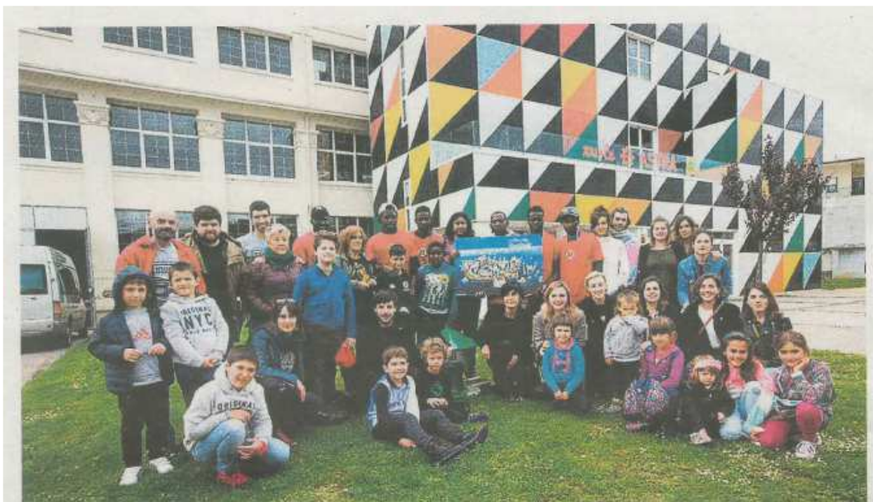
Bonbardaketaren 82. urteurrenean errefuxiatuek piztu zuten Astrako sirena 15:45ean, lehenengo bonbak jaurti zituzten ordu berean. H. AGOBRIA

Bonbardaketaren 82. urteurrenean, iragana Talleres de Gernikako babeslekua irekiz gogoratu dute, eta oraina errefuxiatuen egoera plazaratuz salatu dute.