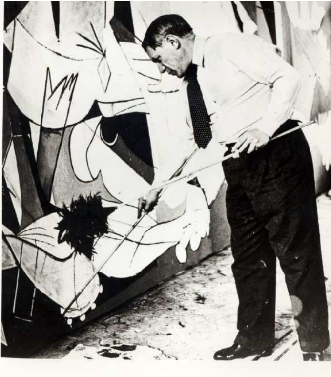
Pablo Picasso peignant « Guernica », photographié par Dora Maar, sa compagne de l'époque.