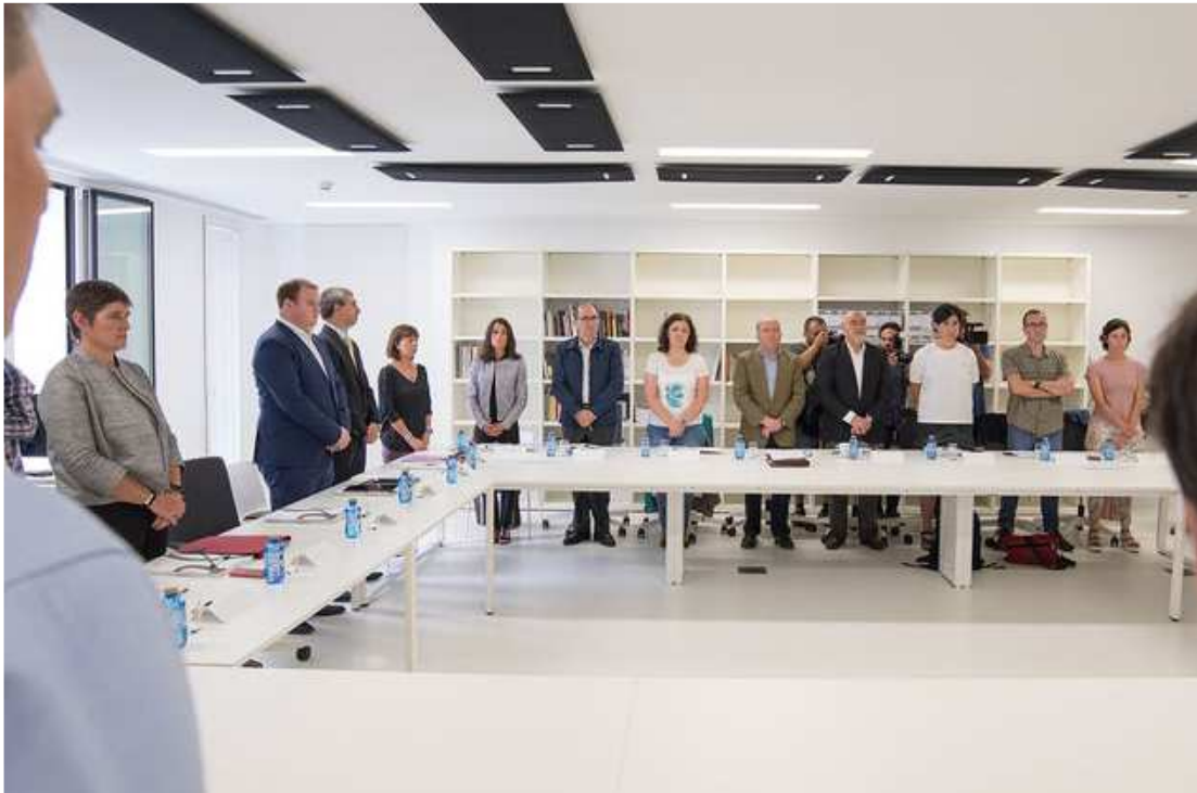
Minuto de silencio en una reunión del Consejo de Gogora IREKIA