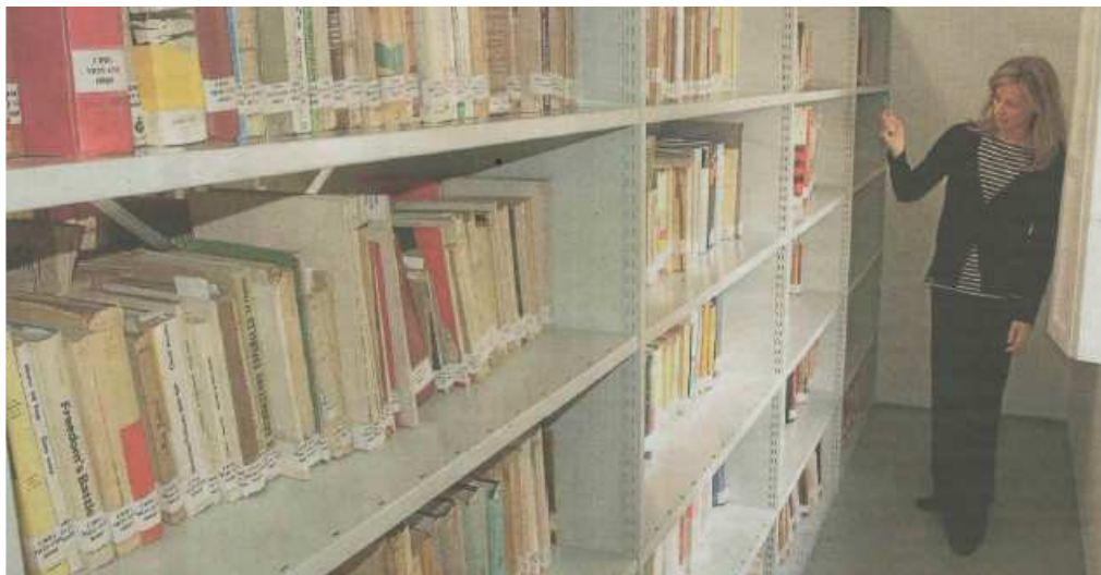
Interior de las instalaciones del Centro de Documentación del Bombardeo de Gernika.