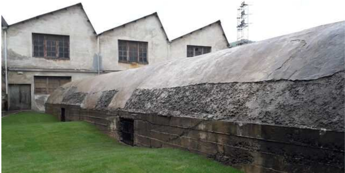
Búnker visto desde la calle en Gernika ELDIARIONORTE.ES