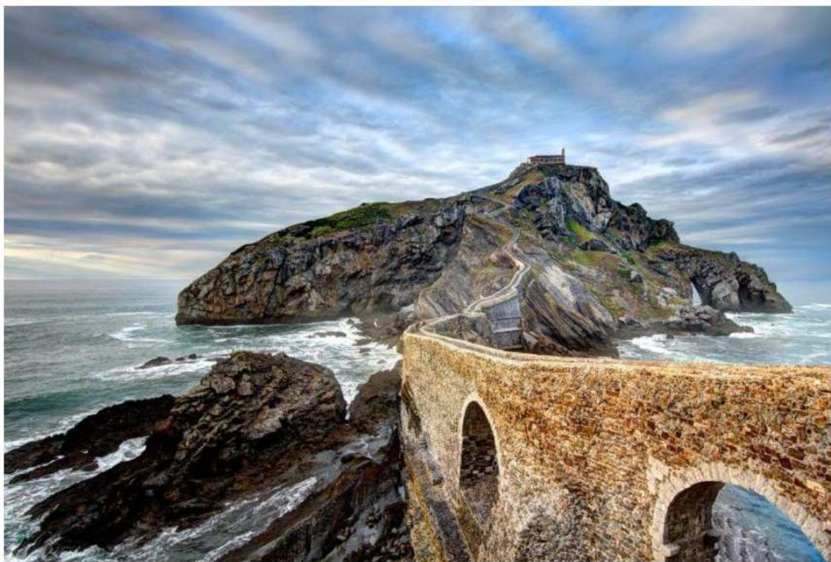
Gaztelugatxeko Doniene.

Bermeo, Mundaka eta Gernika-Lumoko turismo bulegoek Aste Santurako turismo eskaintza bateratua prestatu dute.