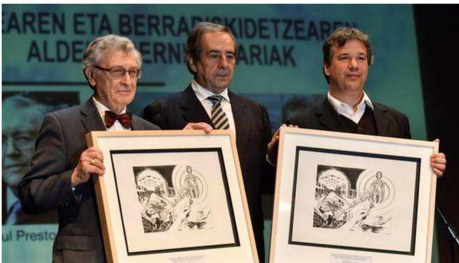
Entrega de los XV Premios Gernika por la Paz y la Reconciliación, celebrado en el teatro Lizeo

EFE - Viernes, 26 de Abril de 2019 - Actualizado a las 13:40h