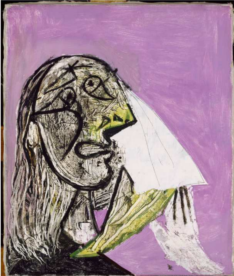
« La Femme qui pleure » (18 octobre 1937) de Picasso.

« Guernica » ne quitte jamais le musée Reina Sofia de Madrid. Mais des œuvres préparatoires sont à Paris pour l'exposition « Picasso et la guerre » au musée de l'Armée, ainsi qu'une photo de Guernica prise dans l'atelier de l'artiste en plein travail, par sa compagne de l'époque, la photographe Dora Maar.