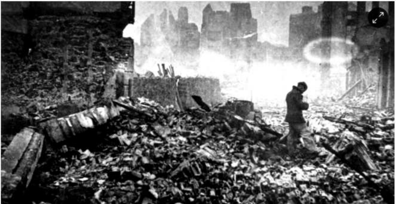
Bombardeo de Gernika.

Un informe oficial del Ejecutivo documenta las muertes en bombardeos, ejecuciones o desapariciones forzosas, unos delitos que no prescriben. Los datos forman parte de una nueva base de datos en la que se seguirán incorporando casos.