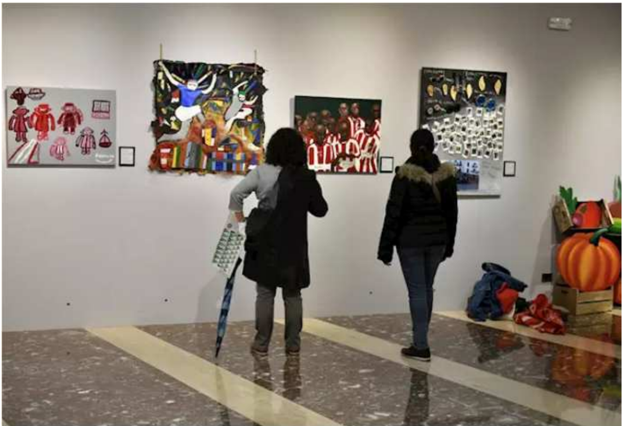
La muestra "Acogida" en la sala de exposiciones de las Juntas Generales de Bizkaia, en su sede den Bilbao.