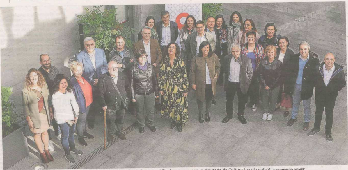
Responsables de los museos vizcaínos, que han promovido 65 actividades para el fin de semana, con la diputada de Cultura (en el centro).