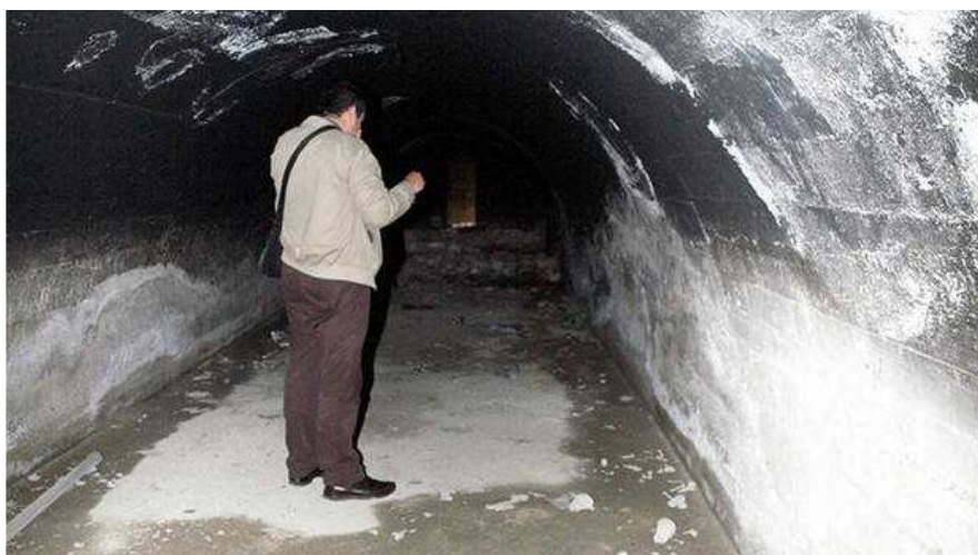
Interior del búnker de Astra, que fue recuperado hace algunos años.

IMANOL FRADUA - Viernes, 5 de Abril de 2019 - Actualizado a las 06:00h