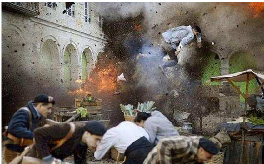
Escena de la película de Koldo Serra sobre el ataque aéreo que sufrió la villa foral el 26 de abril de 1937. / E. C.